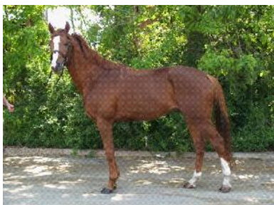
Foto 1. Rasplodni pastuh gidran pasmine