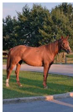
Foto 2. Rasplodna kobila gidran pasmine